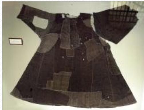
Hábito de Francisco